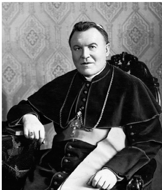
Bõzi Stëga bp Kònstantin Dominik

Napiszë, jak rozmiejesz zdanië z tekstu ks. Damiana Klajsta: „naj czas nié leno pñënie, ale że pñënie za czims i do Kògòs”.