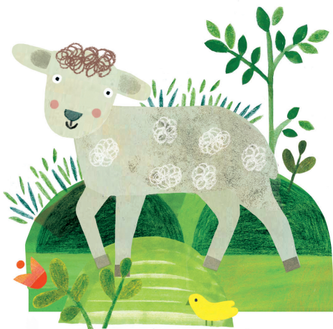
Ilustracja: Ewa Poklewska-Koziełło