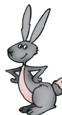
Ilustracja: Joanna Kozłarska