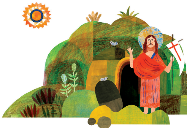
Ilustracja: Ewa Poklewska-Kozieŏto

*Ksãdz Wiesŏw Szěca bět przědnikã Karna Sztuděrŏw Kaszěbŏw „Jutrznio” w pelplińszim seminarium. Terŏczasno je szkolnym w Collegium Marianum w Pelplinie. Pŏchŏdzy ze Brus.