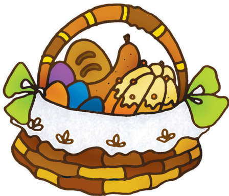
Ilustracja: Joanna Kozłarska