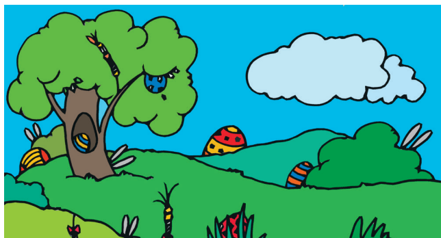
Ilustracja: Joanna Kozłarska

Wszètcè szmakają jastrowé jestkù. Pòzni kòzdi do stòwò mòtã kòrtkã, na jaczi wpisèje, co mù nòbarzi pasowało abò nie pasowało òb czas warzeniò. Wszètcè czètają glosno, co napiselè, i kòrbiã na ten temat ze szkólnym i starszima.